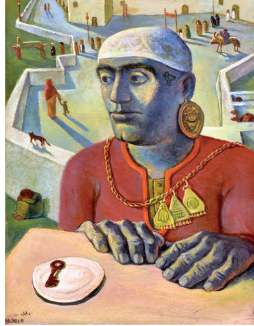
الجزائر، مركز محمد سعيد،

منذ أسبوعين كتبت أننا على موعد فني كبير يحمل عنوان «الإسكندرية- موناكو.. العودة العظيمة»، ويستقبله المتحف القومي للفن الحديث بمدينة موناكو الساحرة، لتتويجا وإحياء لتاريخ طويل وثرى جمع بين الفنانين المصريين والسكندريين وغيرهم القاهريين وبين نخبة كبيرة عظيمة من الفنانين بعض دول البحر المتوسط الذين عاش الكثير منهم في الإسكندرية، وأثر هذه العلاقة التي كانت تربط بين هؤلاء الفنانين على الحركة الثقافية والفنية التي ازدهرت في ذلك الوقت، وبالتحديد فيما يتعلق بياكوزمبوليتانية السريالية كحوار بحر أوسطي. ويكتسب هذا المعرض للفنون التشكيلية أهميته، لأنه يقدم الفن التشكيلي المصري منذ مئتي سنة لكل دول جنوب المتوسط، وأن مصر الحداثة والمفتوحة على العالم في أوائل القرن الماضي كانت جزءا لا يتجزأ من التطور الذي شاهدته المنطقة في كل الجوانب الثقافية، فيكتفي أن الإسكندرية كانت عروس المتوسط عن جدارة لمدة قرن من الزمان، ولذلك كان عنوان المعرض: «موناكو الإسكندرية..